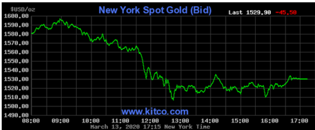
Giá vàng giao ngay tại sàn New York ngày 13/3.

Giá vàng tương lai giảm 4,6% xuống 1.516,6 USD/ounce.